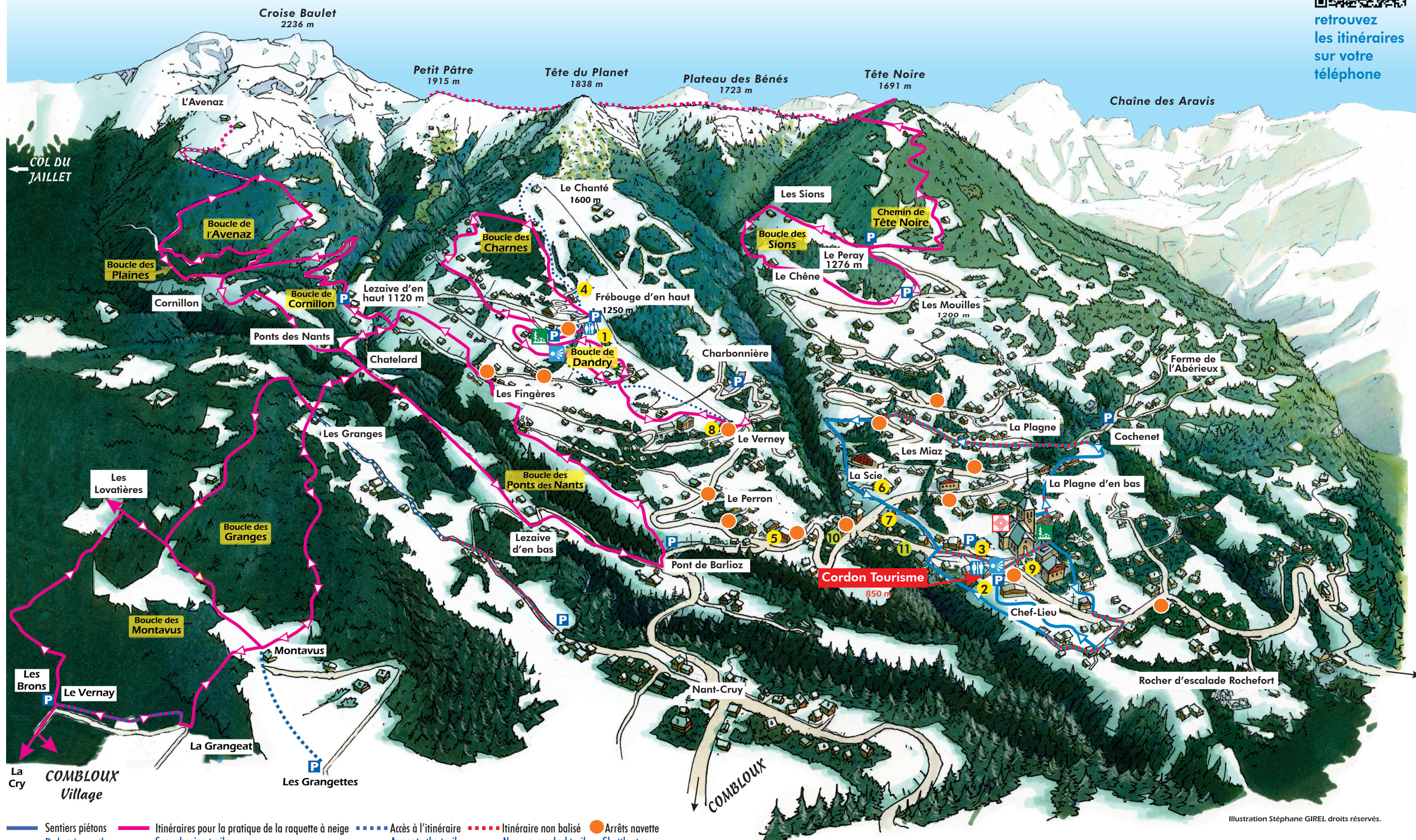
Illustration Stéphane Girel - Droits réservés

retrouvez les itinéraires sur votre téléphone